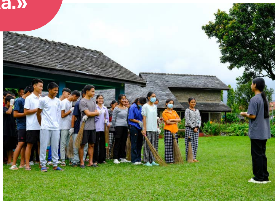
A Gandaki i membri del club dei bambini si trovano ogni giorno per organizzare e svolgere attività.