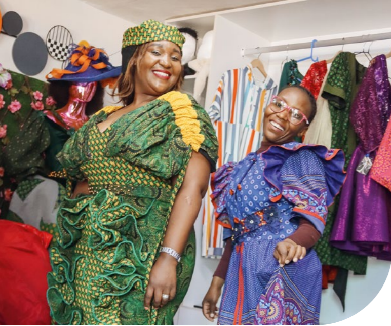
Immagine: Nkay e la sua amica presentano gli ultimi modelli della loro collezione.

«Oggi so di potermi occupare di me e di mio figlio. Sono orgogliosa non solo di quello che faccio, ma anche della donna che sono diventata.»